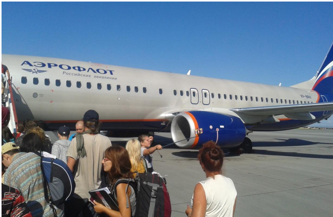
Почетак повратка – Аеродром у Абакану 30.07.2015. године