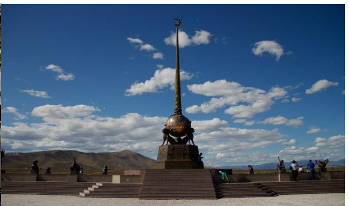
Географски центар Азије