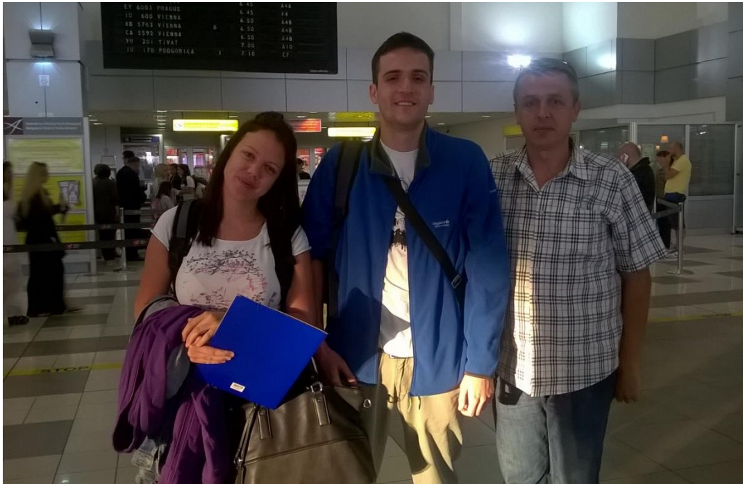
Овако је све почело - Аеродром Никола Тесла Београд, 03.07.2015. године