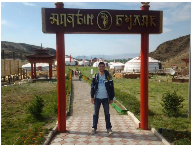
Етно село „Булак“