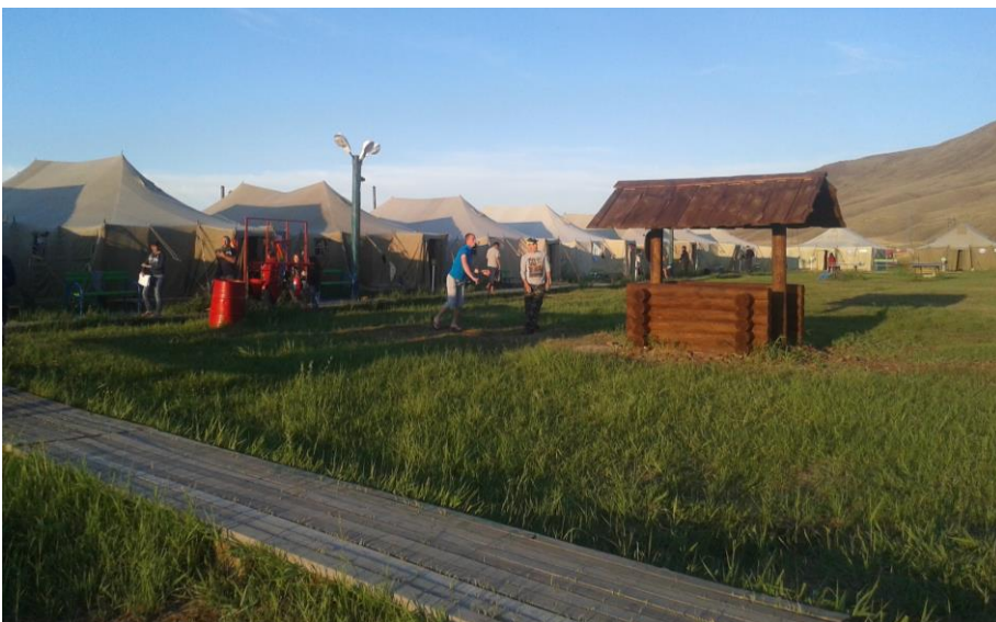
Камп „Долина краљева“