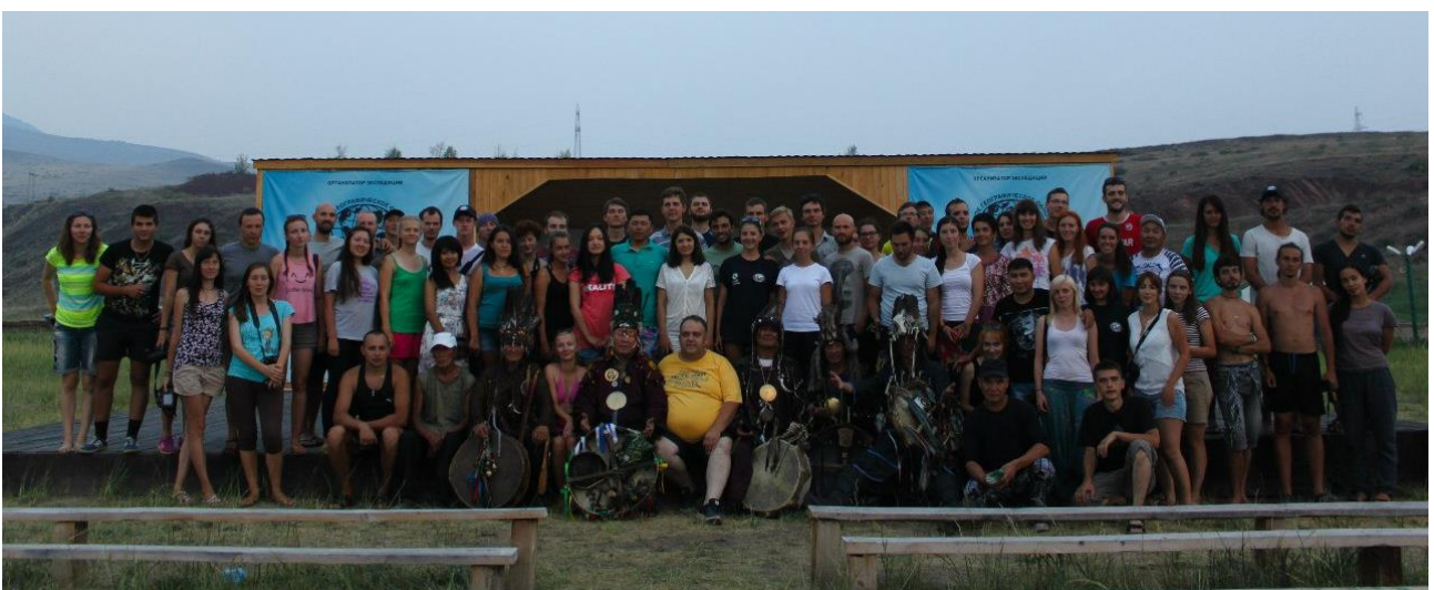
Заједничка фотографија – учесници кампа и шамани