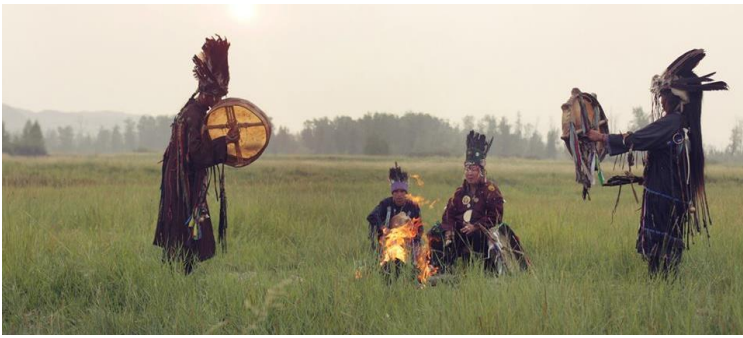
Ритуални обред шамана