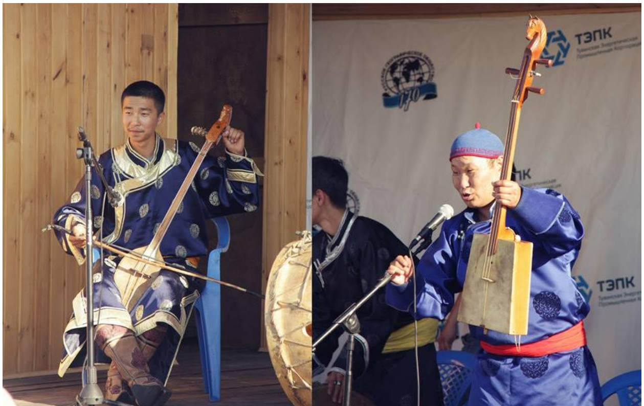
Наступи локалних фолклорних група