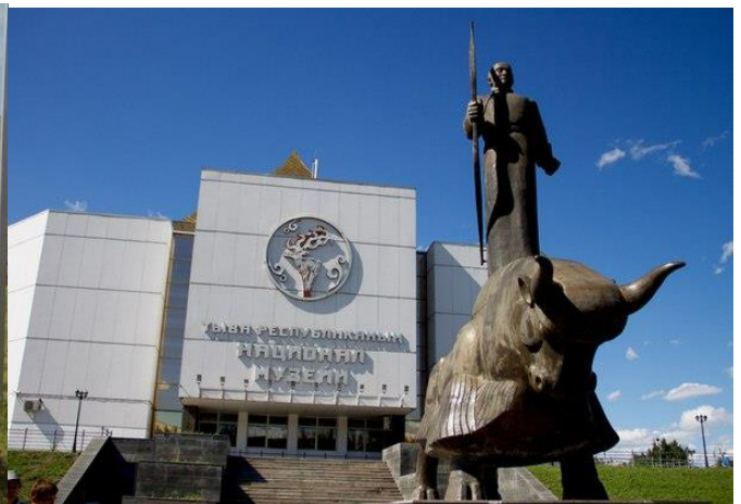
Национални музеј Р. Туве