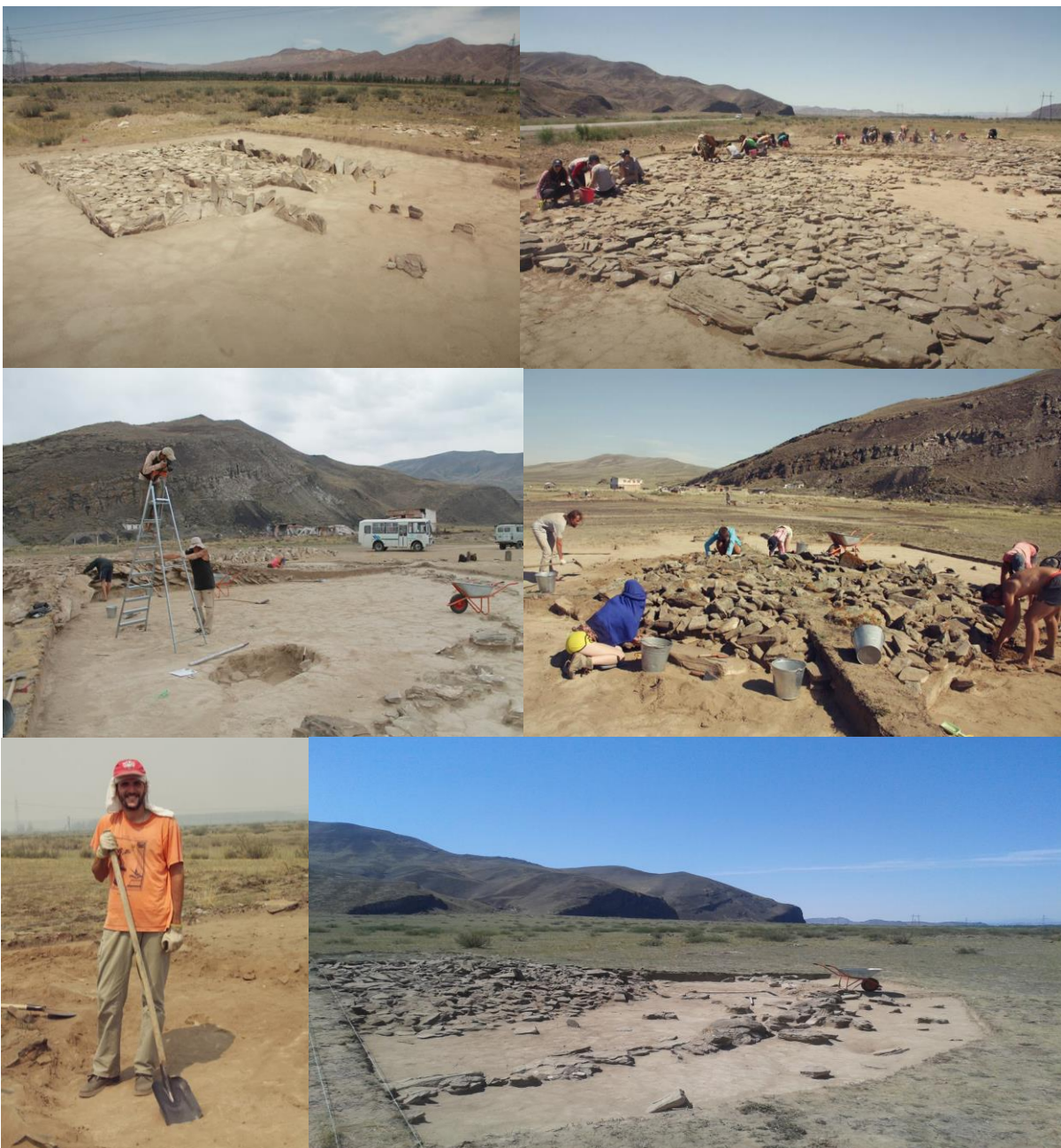
Најчешћи истраживачки локалитети

Недеља је била резервисана за излете и посете културним знаменитостима Р. Туве у ближој околини кампа.